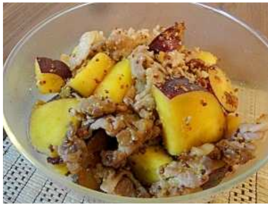
さつまいもと豚肉のマスタード炒め

【豆知識】熱に弱いビタミンCですが、さつまいもに含まれるビタミンCはでんぷんに包まれているため、栄養価が崩れにくいのが特徴です。また、じっくり加熱調理することで、ゆっくりでんぷんの糖化が進むためより甘くなります。皮をむいたさつまいもは空気に触れると変色しやすいので、切ったらすぐに水につけてアクを抜きましょう。